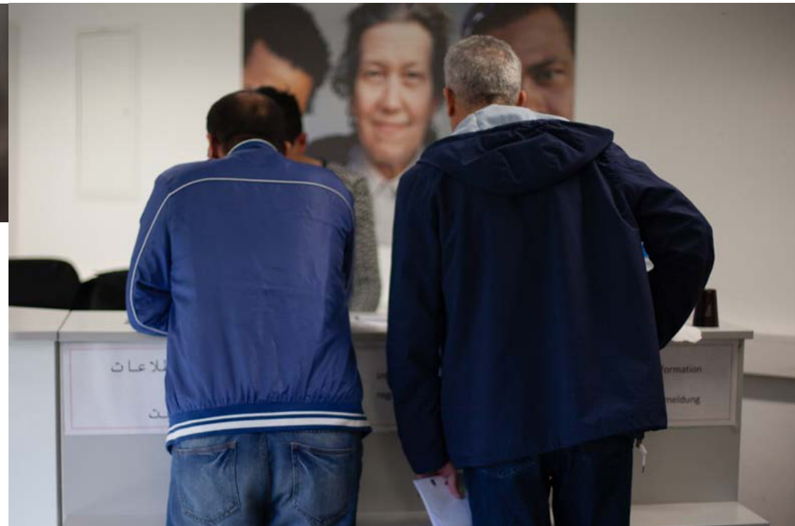
Zwei Männer suchen die offene Beratungsstelle im Ute Bock Haus auf.

Auch die Komplexität der neuen Mindestsicherungsbeantragungen führte zu Unsicherheit. Der erschwerte Prozess und