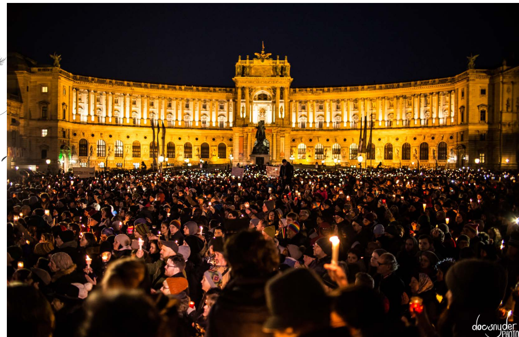
10.000 Menschen gedachten Frau Bock am Wiener Heldenplatz.