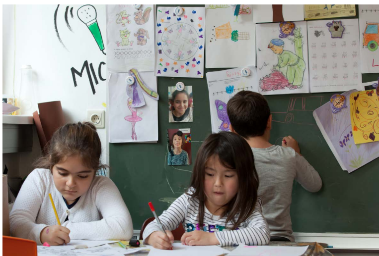
Büffelböcke beim Hausaufgaben machen.

30 Ehrenamtliche Mitarbeiter*innen, bis zu 28 Kinder aus 8 Ländern