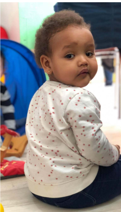
Mädchen bei Bockolino.

Im Ute Bock Haus tragen wir nicht nur dazu bei, Flüchtlinge mit Wohnraum, Beratung und Bildung zu unterstützen, es geht uns auch darum, die Gesellschaft für das Thema Flucht zu sensibilisieren. Aus diesem Grund waren wir auch im Jahr 2018 sehr aktiv auf Veranstaltungen vertreten. Zudem gab es zahlreiche Initiativen rund um das Flüchtlingsprojekt Ute Bock.