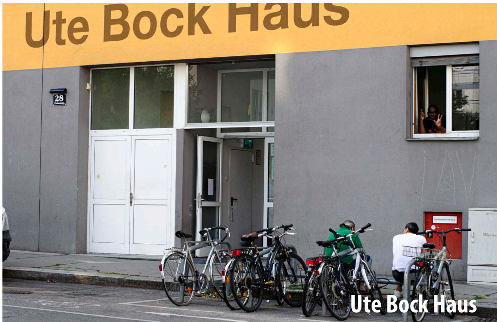
Das Ute Bock Haus in der Zohmannsgasse.